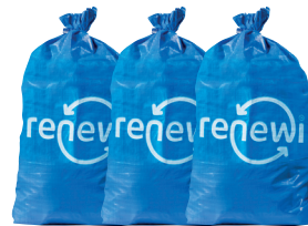
Speciale 75 µm zakken